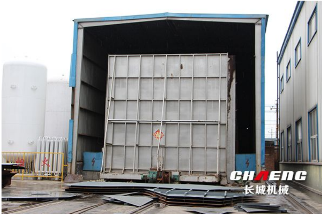
图：为了确保球磨机质量，长城机械采用国内最大的退火炉进行应力处理

5、成品率高，耐用、运转平稳，性能可靠，具有良好的耐磨性，细度在800目，可以根据需要自由调节。