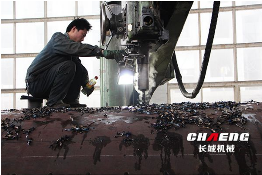
图：工人正在加工筒体