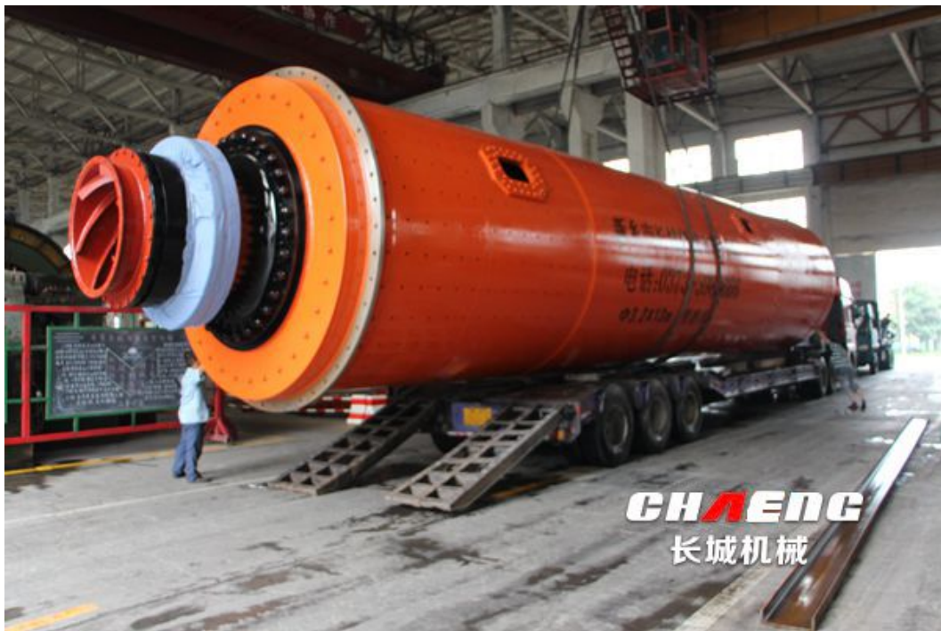
图：正在装车准备发往越南的球磨机